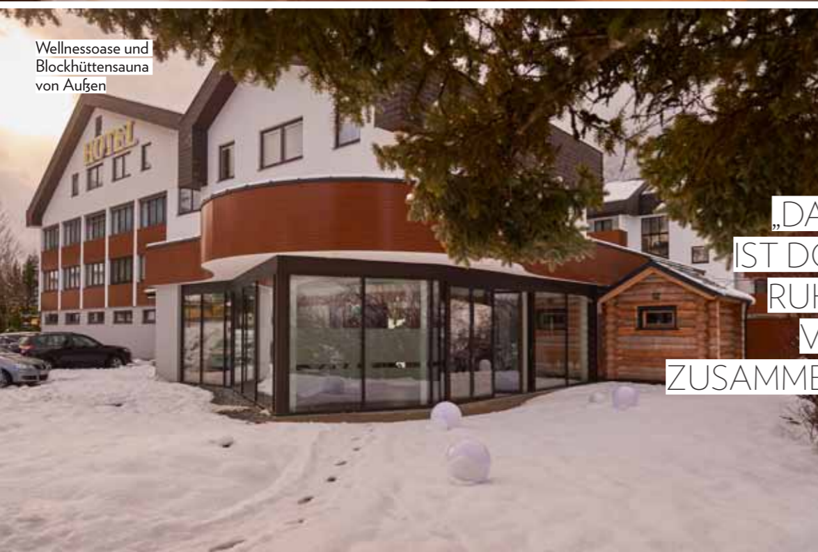
Wellnessoase und Blockhüttensauna von Außen

„DAS PARADIES IST DORT, WO DIE RUHE UND DAS VERGNÜGEN ZUSAMMENTREFFEN!“