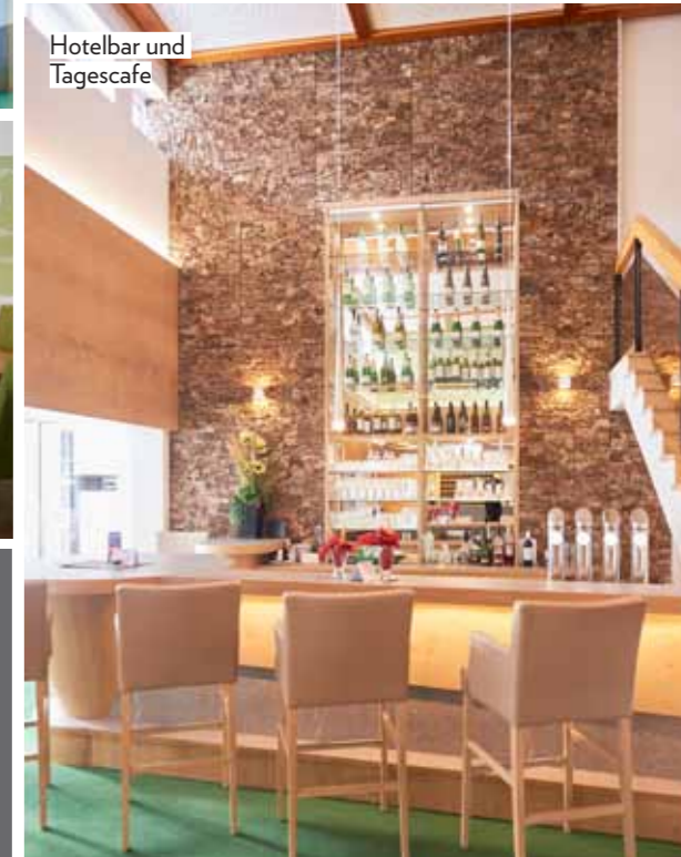
Hotelbar und Tagescafe