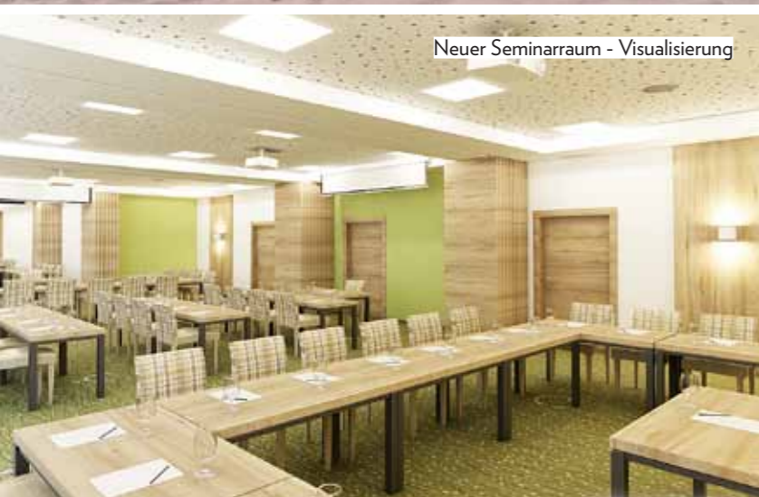
Neuer Seminarraum - Visualisierung