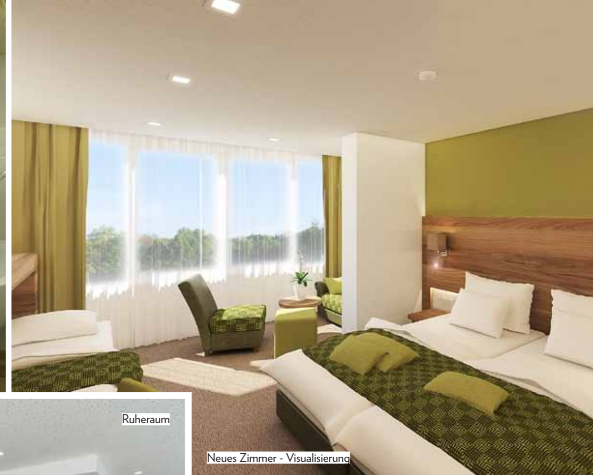
Neues Zimmer - Visualisierung